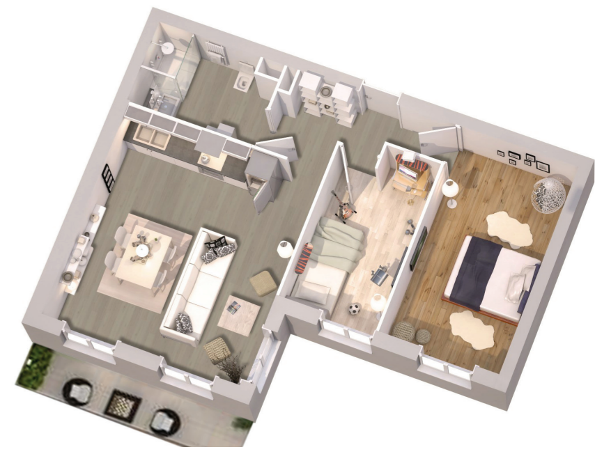
Exemple de logement de type 3